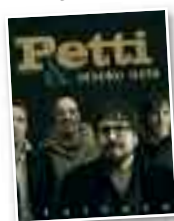
CD Musika "Hortzikarak"