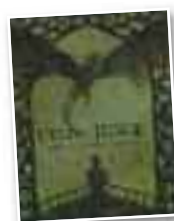
DVD telesaila "Juego de Tronos"