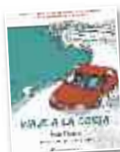
Narratiba "Viaje a la costa"