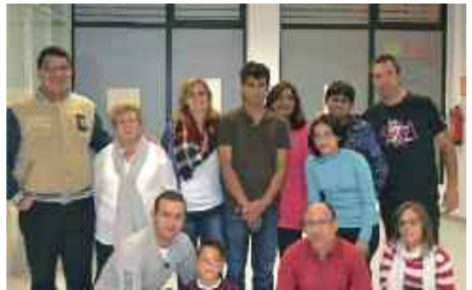
Etorkinak eta bertakoak, Auzokideak eta Auzotarrak. Denek osatzen dute Auzoko