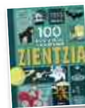
Haur liburua "100 kontu ondo ezagu..."