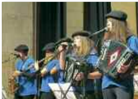
Oñatiko musika eskolako ikasleek ere parte hartuko dute Alemania, Suitza, Letonia eta Albaceteko musikari gazteekin batera.