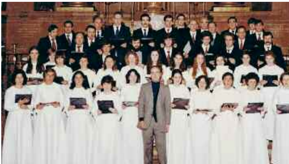
1980ko abenduan Urretxuko parrokian emandako kontzertuko irudia