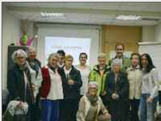
Bizipoz programan parte hartu duten kideetako batzuk

Bizipoz programaren barruan egon diren lau taldeetako batek hizkuntzen gaia landu du, bidaiekin lotuta. Eta orain Ingeleseko mintzapraktika talde bat sortzea erabaki du, komunikatzeko gaitasuna lantzeko helburuarekin. Ekainaren 6an informazioa emateko bilera irekia egingo dute Pake Lekun, alargunen gelan, 16:00etan.