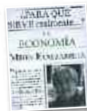
Ekonomia liburua "¿Para qué sirve realmente la economía?"