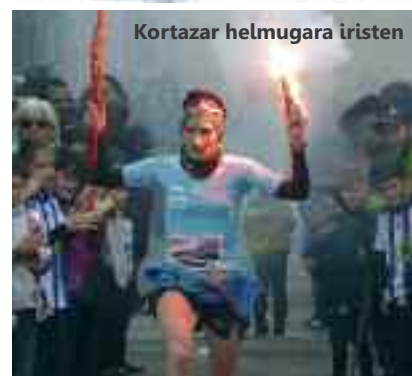
Kortazar helmugara iristen