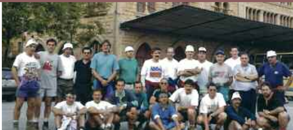
Oñatin abiatu, eta Lizarra izaten da mendigoizaleen helmuga.

Goizeko 4etan irtetzen dira Oñatitik (San Martineko zubitik) eta arratsaleko 7ak aldera iristen dira Lizarrara, 70 bat kilometroko ibilbidea osatuta. Dutzatu, bapo afaldu, eta buelta etxera. Eulaten bazkaldu ohi dute, eta bertan autobusa egoten da, badaezpada, norbaitek travesia bertan behera utzi behar izanez gero. Aurten, urte berezia izanik, Ganuzara ere joango da autobusa, eta nahi dutenek, handik Lizarrarainoko azken tarte (13 km.) egiteko aukera izango dute. Dagoeneko 57 lagunek eman dute izena.